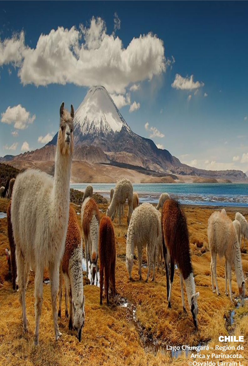
CHILE Lago Chungará – Región de Arica y Parinacota.