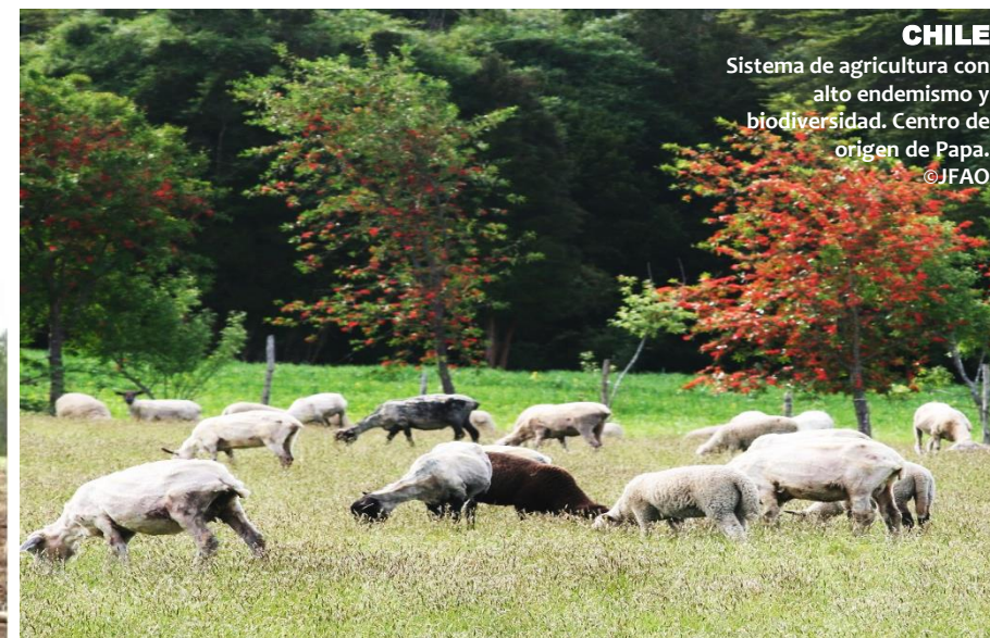
CHILE Sistema de agricultura con alto endemismo y biodiversidad. Centro de origen de Papa.