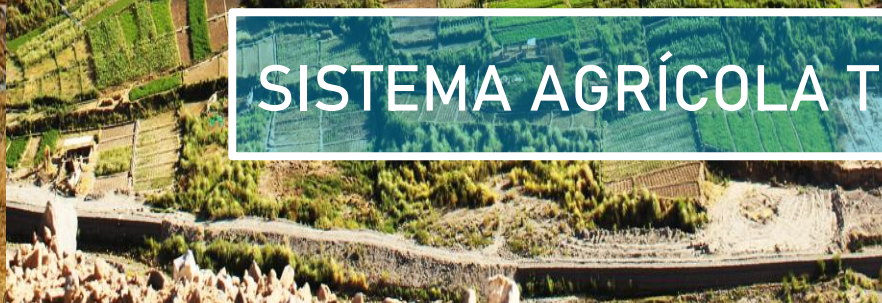
CHILE Terrazas localidad de Toconce – Región de Antofagasta.