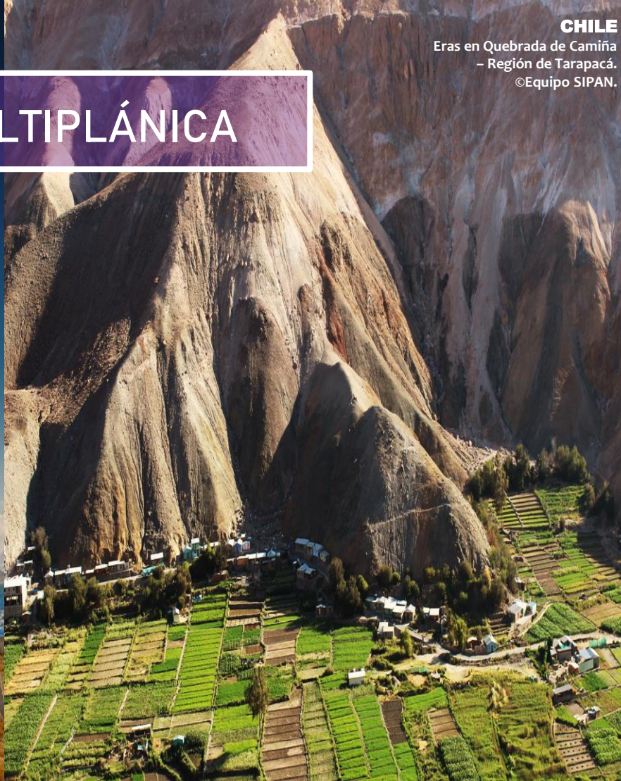
CHILE Eras en Quebrada de Camiña – Región de Tarapacá.